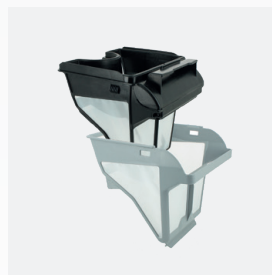
Bac filtrant Filtre double niveau : 150/60 µ