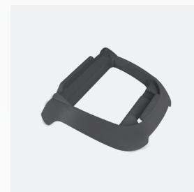
Socle pour boîtier de commande