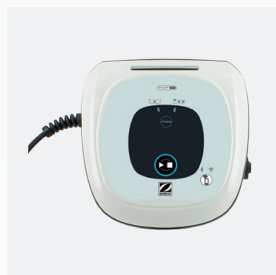
Boîtier de commande