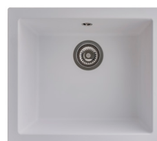
17 : BLANC UNI