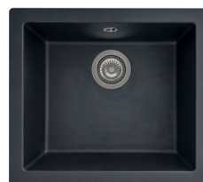
06 : NOIR PAILLETÉ

Évier avec cuve sous plan · Installation sous plan avec pattes de fixation adaptées