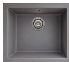
16 : GRIS BÉTON