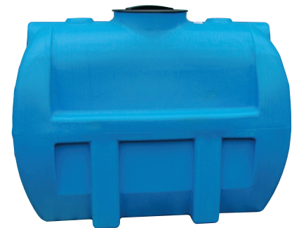
Réservoir horizontal : RS 1300